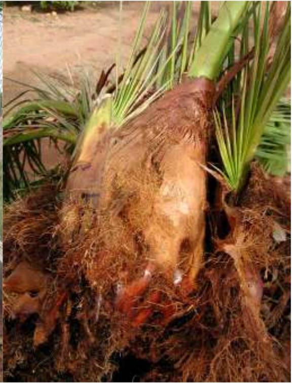
Base de las hojas podridas