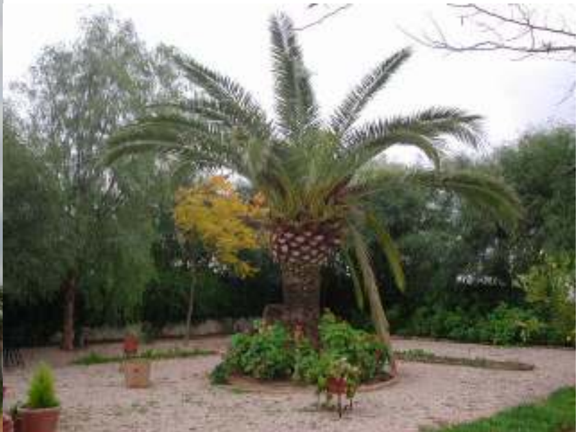
Palmera afectada (perdida yema principal)