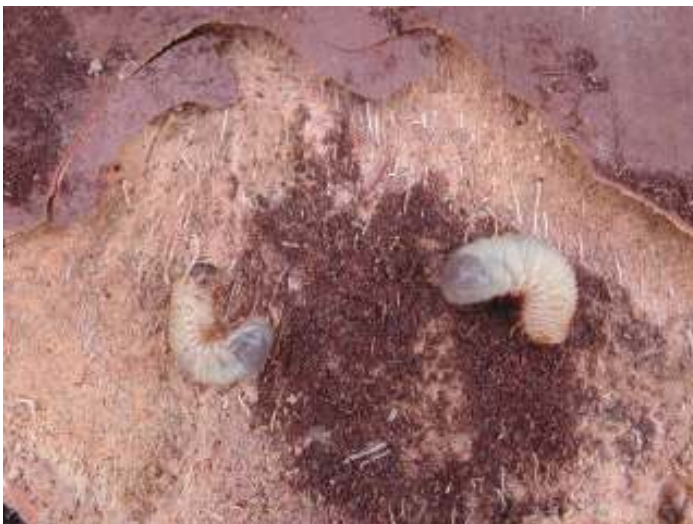
Melolontha melolontha L