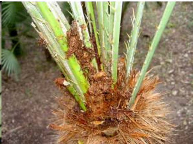
Daños en hojas