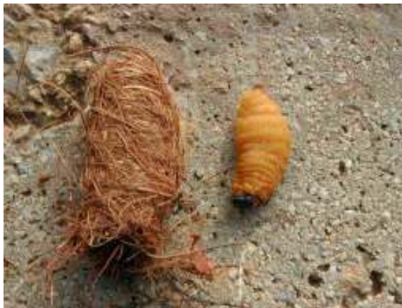
Larva inicio ninfosis