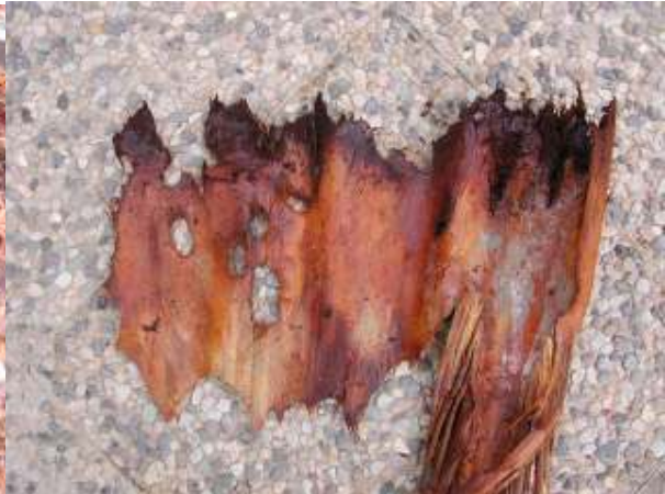
Orificios de salida