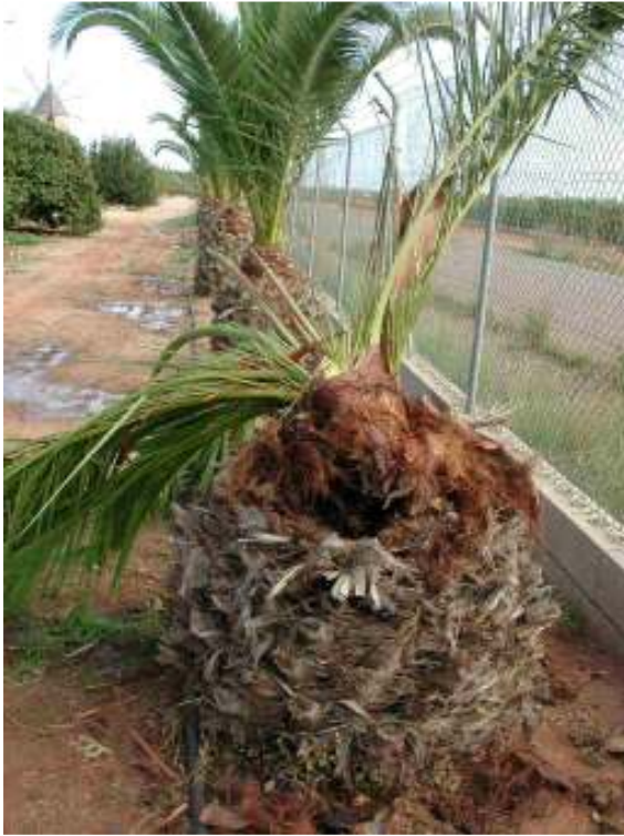
Palmera totalmente afectada