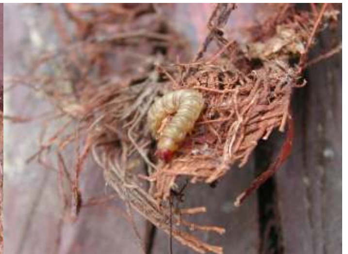
Otras orugas (pendientes de clasificar)