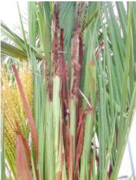
Daños en hojas