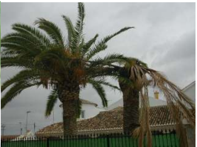
Primera palmera afectada