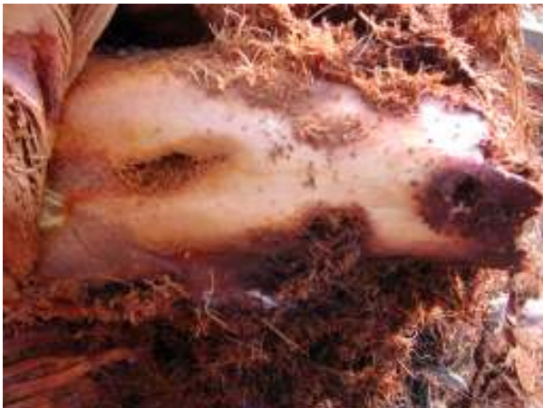
Perforaciones base de las hojas